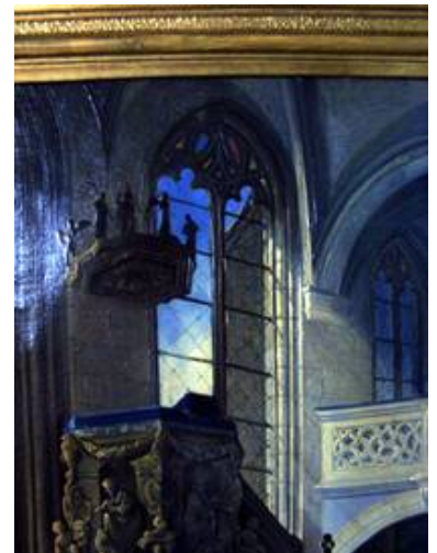
Dieses Gemälde dokumentierte deutlich die ursprüngliche Verglasung.