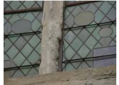
Die Steinschäden an der Schlosskapelle waren erheblich; gut zu erkennen auch die Aufteilung der Bleifelder und die ursprünglichen Orte der Glasmalereischeiben.