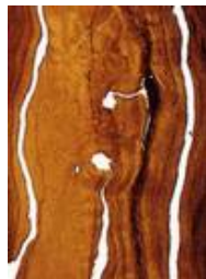
Furnier in Glas