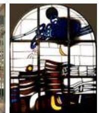
Entwurf: E. Schütze