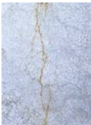
Marmor in Glas