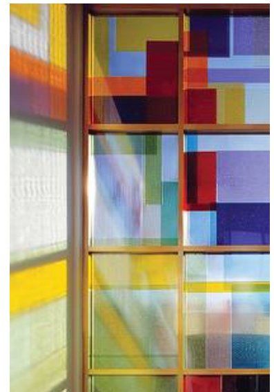
Ausschnitt aus dem großen Fenster der LZB in Meinigen, Architekturbüro Prof. Kollhoff, Entwurf: Prof. Federle