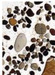
Kieselsteine in Glas