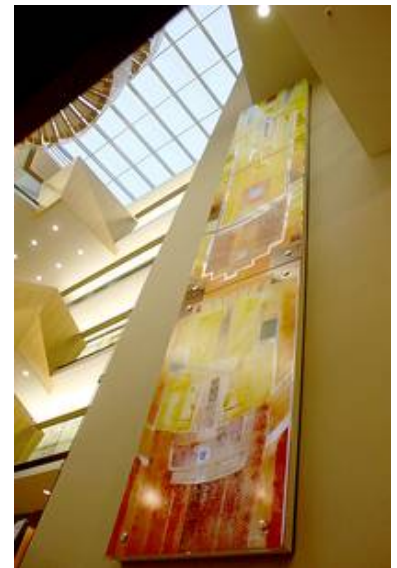
Moderne Glasgestaltung in einem Bürogebäude

Kontaktieren auch Sie uns zur Umsetzung Ihrer Ideen.