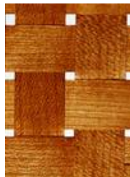
Holzgeflecht in Glas