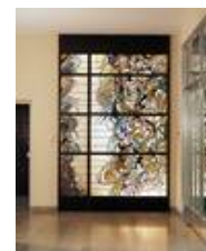
Entwurf: F. May