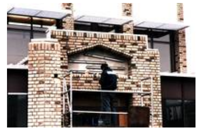
Auch die Hinterleuchtung der Glasgestaltung kann von uns ausgeführt werden