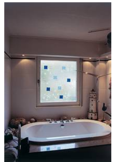
Statt gewöhnlichem Ornamentglas wurde in diesem Badezimmerfenster eine Schmelzglasscheibe (Fusingscheibe) mit abgeformten Muscheln und Seesternen eingesetzt.