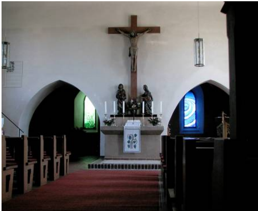
Die beiden Fenstre nach dem Einbau in der Kirche