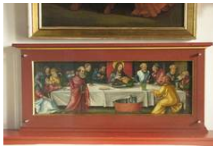
UV++Schutzscheibe vor Bildtafel aus dem 16. Jahrhundert