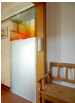
gestaltete elektrische Schiebetür