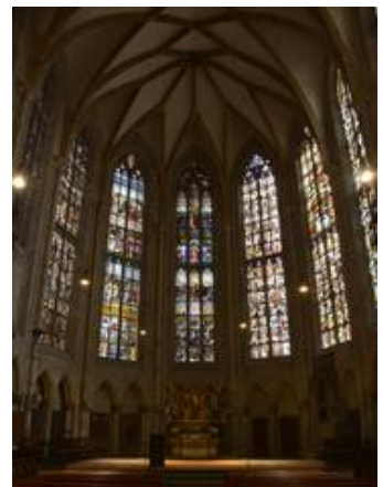
Chor im Münster zu Ulm (Konservierung)