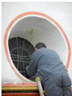
in situ Reparatur eines Kirchenfensters