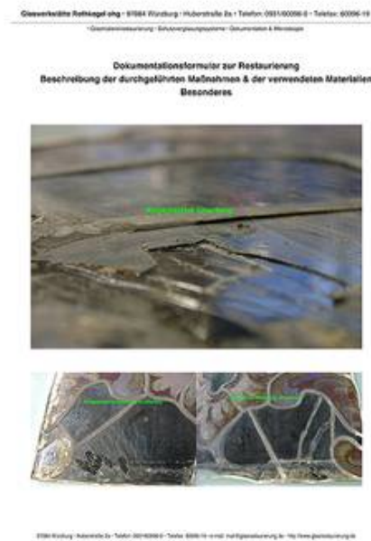
Auszug aus der Fotodokumentation des abgeplatzten Überfangglases.

Nachfolgend sehen Sie einen Auszug aus der Dokumentation hierzu.