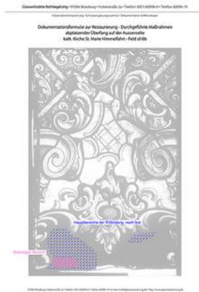
Auszug aus der grafischen Dokumentation des abgeplatzten Überfangglases.