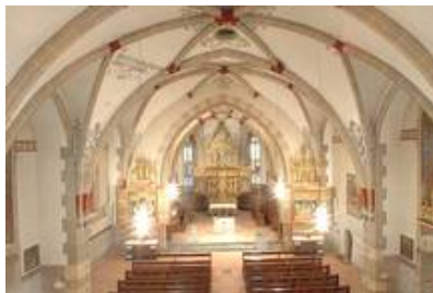
Poschiavo (CH) kath. Kirche