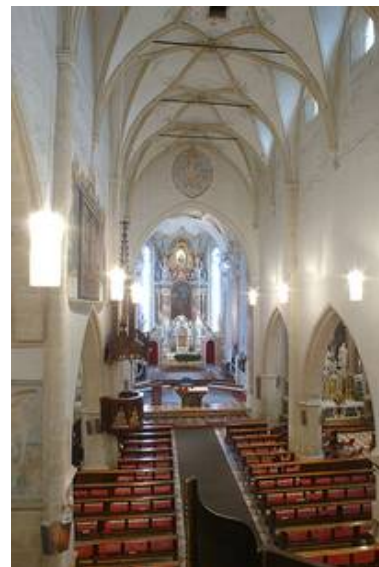
Lienz (A) - kath. Kirche St. Andrä