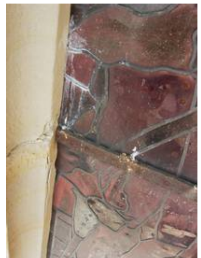
Auch der zunehmende Rostdruck durch die Eisen und die Schäden am Sandstein machten einen Ausbau der Glasmalereien dringend nötig