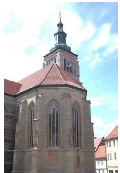
Der Chor von Außen nach den Arbeiten

Auch hier war es uns wichtig durch umfassende Besprechungen mit dem Bauherrn und dem Landesdenkmalamt ein gutes Restaurierungskonzept gemeinsam zu erarbeiten.