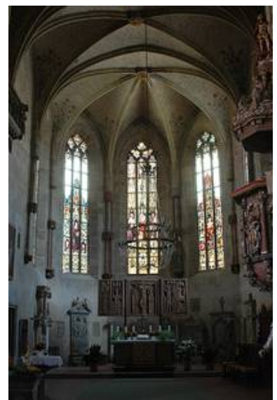
Der Chor von innen nach den Arbeiten