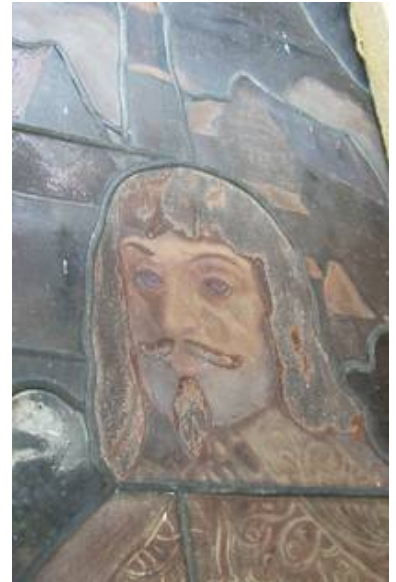
Diese Aufnahme der Malschichten läßt die Bedeutung einer Außenschutzverglasung nach dem derzeitigem Stand der Technik erahnen