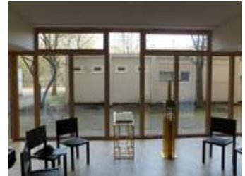
Der Raum vor Montage der Glasgestaltung. Es ist offensichtlich, dass ein Blick durch klares Glas nicht immer meditativ ist...