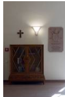
WS 09/W 10 T

So verbindet sich moderne, energiesparende Technik mit zeitlosem Design. Gerne beraten wir Sie auch in Ihrem Projekt.