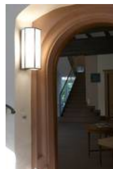
WS 09/W 14 T