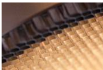
Das Blendraster kann mit verschiedenen Leuchten

Inwieweit das Raster eine Auswirkung auf die Bestückung des Downlights hat wird aktuell mit Kontrollmessungen untersucht.