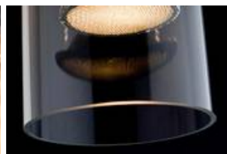
und unterschiedlichen Reflektoren kombiniert werden