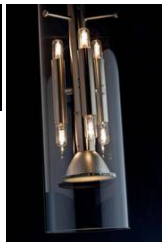
ML 04/P 2-7 mit klarem überlagem Glaszylinder und Blendraster