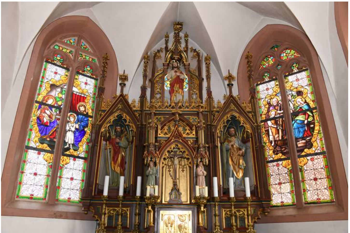
Übersicht des, nun wieder harmonischen Gesamtensembles mit Altar und beiden Fenstern