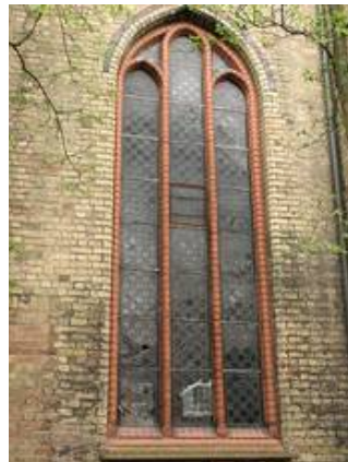
NVII im Vorzustand, deutlich erkennt man einige provisorische Sicherungsmaßnahmen; die mehr als deutlich die Probleme des Vandalismus zeigen