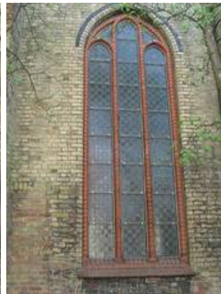
NVII im Nachzustand, die Edelstahlgitter fallen kaum auf und sind, gerade wenn man an die Vandalismusprobleme denkt, mehr als hinnehmbar