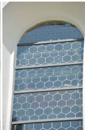
Auch in der Nahaufnahme zeigen die Chorfenster die klassische Ansicht einer Bleiverglasung