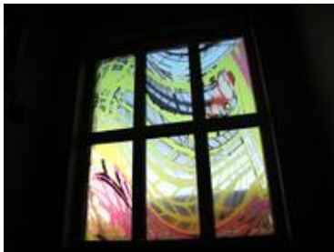
Das obere Fenster an einem späten Sommernachmittag