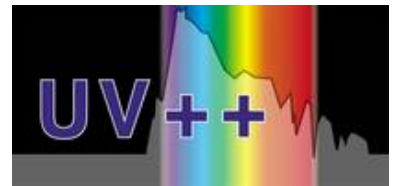
Der UV++Schutz der weiter denkt!

Gerne schützen wir auch Ihre moderne Kunst gegen photochemische Alterung.