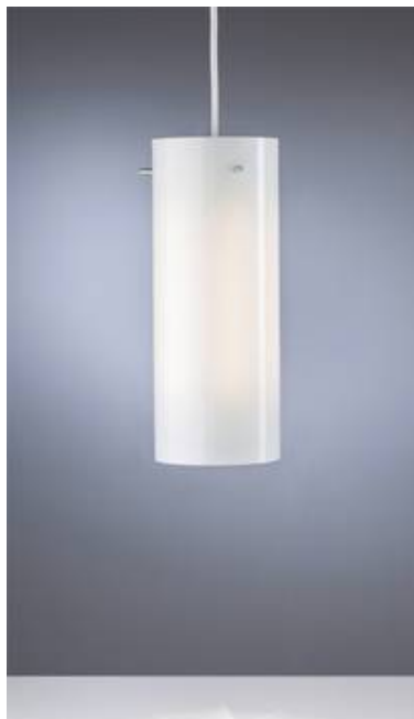
mit Glaszylinder aus Milchüberfangglas

Hier finden Sie unsere aktuellen LED-Modelle